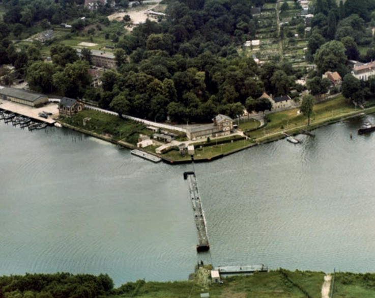
Pontonsperre am Grenzübergang für Schiffe Nedlitz (ca. 1985) Pontoon barrier of the Nedlitz maritime border crossing (ca. 1985)

Der Bereich zwischen der Glienicker Brücke und dem Cecilienhof im Neuen Garten zählt zu den beliebtesten Ausflugszielen in Potsdam. Nur noch wenig erinnert daran, dass hier, im heutigen UNESCO-Weltkulturerbe, bis 1990 die Grenze zwischen der DDR und Berlin (West) verlief. Auf acht Informationsstelen erläutert die Ausstellung den Aufbau der Sperranlagen und thematisiert den Alltag im Grenzgebiet. Der Infopfad reicht von der Glienicker Brücke bis hinauf zur Bertinistraße, wo sich zwischen 1965 und 1990 ein zentraler Grenzübergang für den Schiffsverkehr zwischen Ost und West befand.