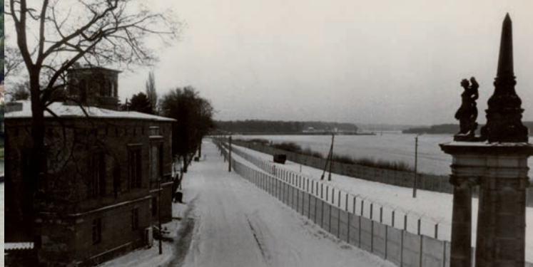
Der Todesstreifen an der Villa Schöningen (ca. 1985) The death strip at Villa Schöningen (ca. 1985)

Mehr Informationen | More information www.grenze-potsdam.de